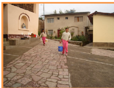
Niñas en Huancarana ( Perú)