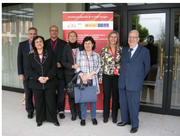
Participación en la Jornada de economía Social organizada por la Presidencia española en Toledo en 2010

- Frente a la pobreza, la exclusión y la marginación que afectan a los seres humanos, sectores sociales y pueblos enteros en diversas regiones del mundo/ la economía solidaria ofrece ser una alternativa capaz de ofrecer soluciones a las bolsas de pobreza conducir operando con mayor eficiencia, permitiendo la reinserción social y el progreso de sectores que con base en el trabajo desarrollan proyectos de emprendeduría que les permiten generar ingresos y elevar su precario nivel y calidad de vida