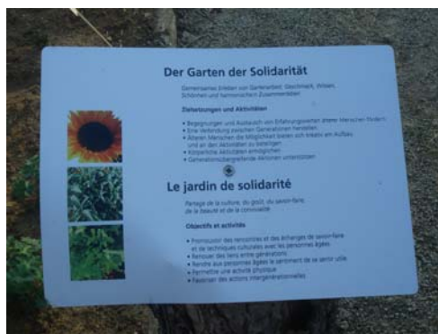
Agricultura ecológica en Luxemburgo

Ante la situación de crisis creada por un crecimiento económico incontrolado, la economía solidaria apuesta por un nuevo tipo de desarrollo, alternativo, integro y sostenible con énfasis en lo local. Es un modo nuevo de pensar y de proyectar procesos transformadores eficaces y profundos, en condiciones de conciliar la conciencia y la voluntad en la búsqueda de aquellos que anhelan una vida mejor y una sociedad más humana.