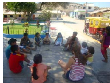
Voluntariado en Piura con niños de la Municipalidad