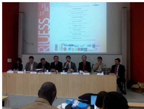
Fotos: Actos en la Universidad de Poitiers