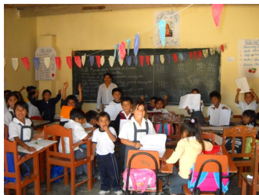
Proyecto de creación de bibliotecas en Piura