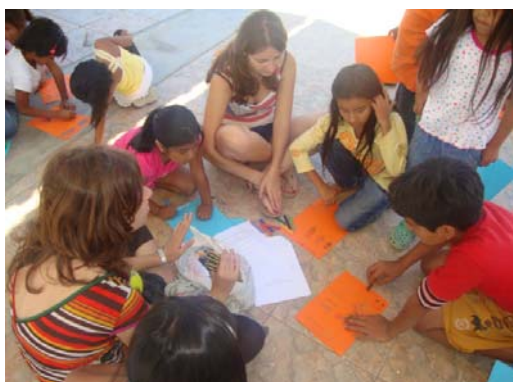
Voluntariado en Colán (Perú)

para niños de 3 a 13 años en la Plaza del pueblo. Cada actividad estaba relacionada con un tema de acuerdo con las escuelas que trabajan allí reforzando sus conocimientos.