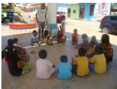
Voluntariado en Colán (Perú)