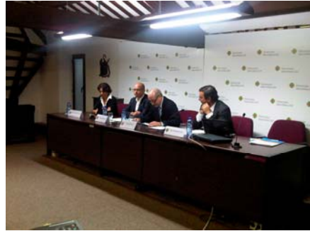
Los ponentes en diferentes mesas redondas