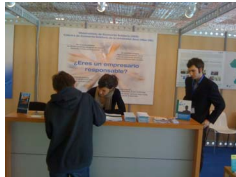
Foto: Stand de la Cátedra de Economía solidaria en la Feria Inserciona