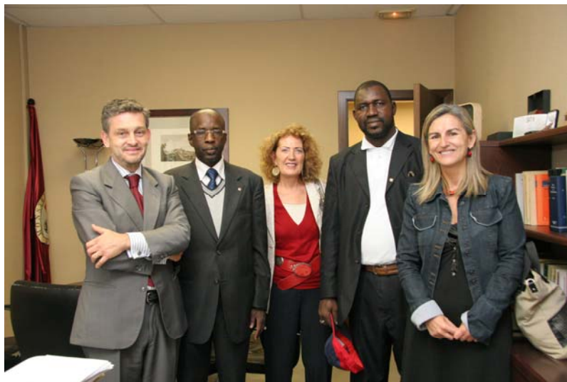
Visita del Ministro de artesanía de Mali a la Universidad