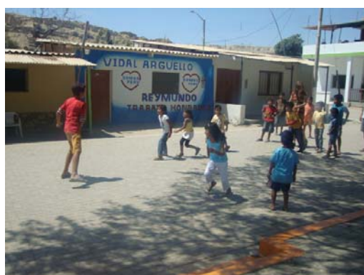
Voluntariado en Colán (Perú)