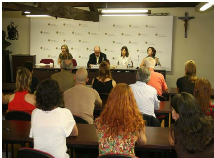
Acto de clausura de la 5ª edición del master en gestión y comunicación en economía social y solidaria