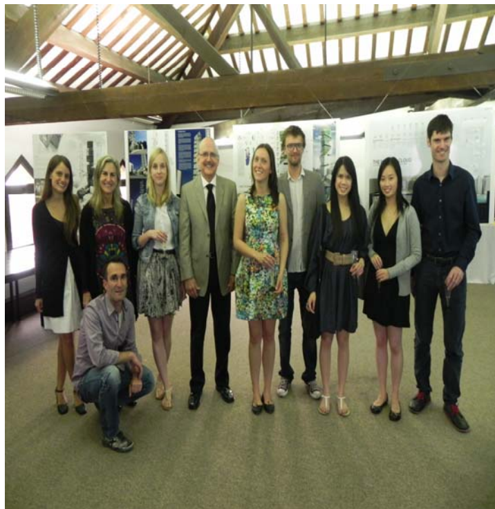
Fotos de los ganadores

Actualmente, Architectum trabaja en el proyecto de "Albergue Ecológico" a proyectarse, intenta ser un nuevo modelo de prototipo de hospedaje a nivel mundial, uno en el que lo importante sea el disfrute del paisaje, del medio ambiente y no tanto del confort que pueda brindarle. Dentro de éste esquema éste "Albergue Ecológico" es más un lugar donde ser que donde estar, de disfrute del contexto antes que del disfrute de la infraestructura. De tal modo se libera al medio ambiente de los residuos contaminantes, producto de la pesada rotación de huéspedes, valorando más la experiencia temporal y vivencial del evento en sí (la observación de la ciudadela de Tikal) antes que la eficiencia y complejidad que puedan brindar sus instalaciones para un hospedaje permanente.