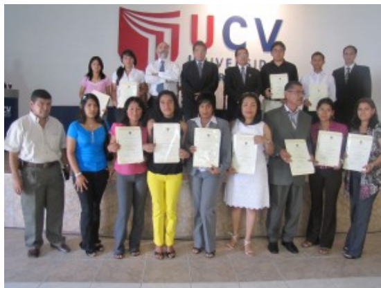
Promoción de emprendedores solidarios en la Universidad Cesar vallejo

Debido a las exigencias del mercado laboral actual y los constantes cambios en el campo del conocimiento, cientos de profesionales realizan actualizaciones para sumar ventajas competitivas de cara a dichas exigencias. En este contexto, diferentes profesionales de la región cursaron el diplomado “Acción Formativa de Gestores en Economía Solidaria y Responsabilidad Social”, que culminó el pasado 22 de enero con la ceremonia de entrega de diplomas a los participantes del curso, el cual estuvo organizado por la Oficina de Cooperación y Relaciones Internacionales de la UCV Piura, en coordinación con la universidad Abat Oliba CEU de España.