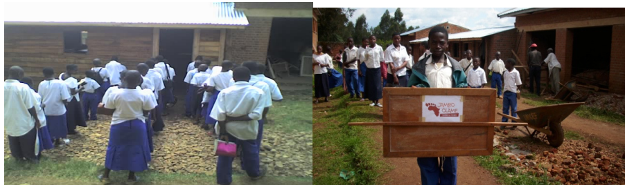
Local de l'Associación Amigos del Cerezo