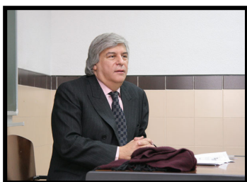
Foto_: Ilmo Sr. Fernando Oliveras

El Ilmo Sr. Fernando Olivera, ex Embajador de Perú y actual presidente del presidente del Centro Global para el Desarrollo y la Democracia, impartió la conferencia: "Desarrollo global y países del Sur" dando por inaugurada ña 4ª edición del Master en Gestión y Comunicación de Entidades Sociales y Solidarias