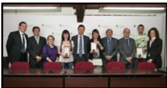
(Foto: personalidades asistentes al Acto de entrega de premios y los alumnos galardonados)

El objetivo de estos premios es promover la producción periodística en áreas específicas de Periodismo que, desde el vicedecanato de Periodismo de la UAO, se quiere promover de forma particular de acuerdo con las líneas de investigación y especialización de este centro universitario. También se busca promover la capacidad creativa y de producción periodística de nuestros alumnos, incentivándolos a realizar trabajos periodísticos sobre áreas particulares que abran vías de colaboración con medios de comunicación y entidades especializadas.