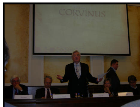
(Tibor Palanky, Catedrático de la universidad de Corvinus; Michael Lake, representante de la UE de los países del Este en su intervención durante la conferencia internacional organizada en Budapest)