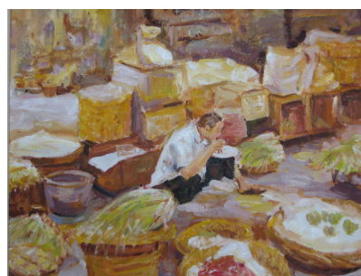
(Fotos: Mercedes García (en el centro); una de las pinturas de la exposición “mercado oriental”)