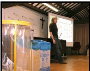
(Foto: instantánea durante la conferencia y taller sobre reciclaje)

El acto puso de manifiesto el elevado grado de conocimiento y sensibilización de los jóvenes estudiantes del centro educativo Llor quienes también aportaron a la Jornada sus iniciativas, coordinadas mediante el colegio y mediante la comisión estudiantil del Medio Ambiente, una iniciativa pionera del Llor que pone a los estudiantes al frente de las propuestas de mejora medioambiental de la misma escuela.